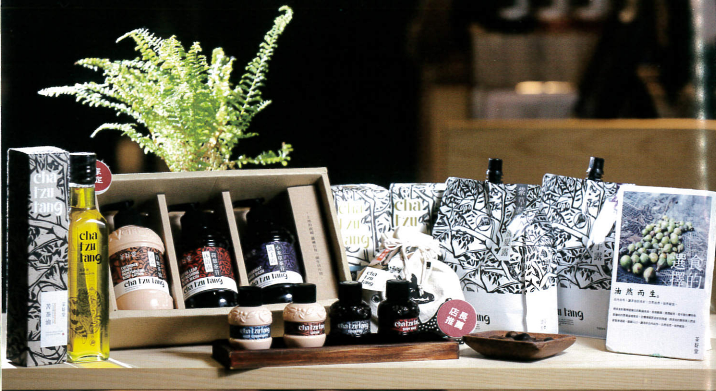
▲ 茶籽堂從開發出油茶籽清潔產品起家，然後跨入苦茶油製油領域、與農民進行油茶的栽培契作，開發苦茶油產品。