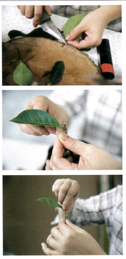
▲ 油茶樹小苗的扦插、嫁接。

進行扦插、嫁接的無性繁殖實驗，結果扦插苗、嫁接枝的結實表現與茶籽品質，與母本同樣優異。